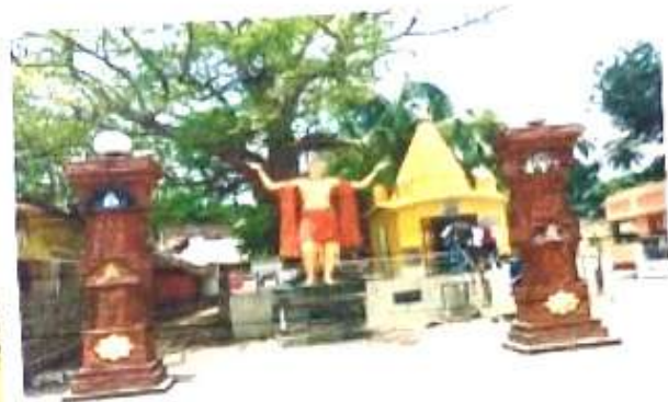
চিত্র নং ১০ (রোমকেলি)