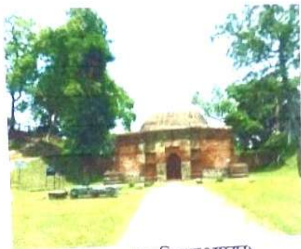
চিত্র নং, ৪ (শুমতি দরওয়াজা)