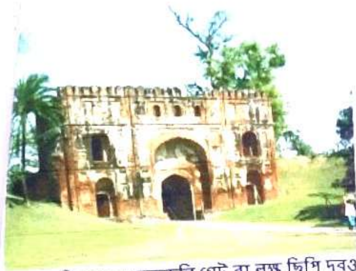
চিত্র নং, ৭ (লুকোচুরি গেট বা নক্ষ ছিপি দরওয়াজা)