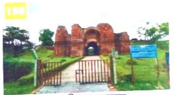
চিত্র নং, 6 (দাখিল দারওয়াজা)