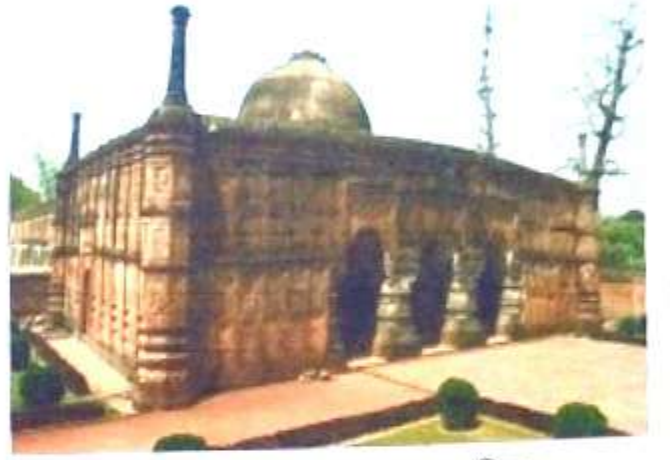
চিত্র নং, 2 (কদম বসুল মসজিদ)