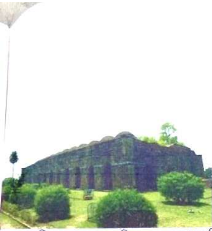
চিত্র নং, 1 (বারদুয়ারি বা বড় সোনা মসজিদ)।