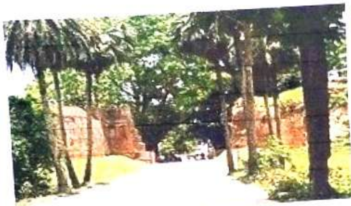
চিত্র নং, ৯ (কোতোয়ালি দরওয়াজা)