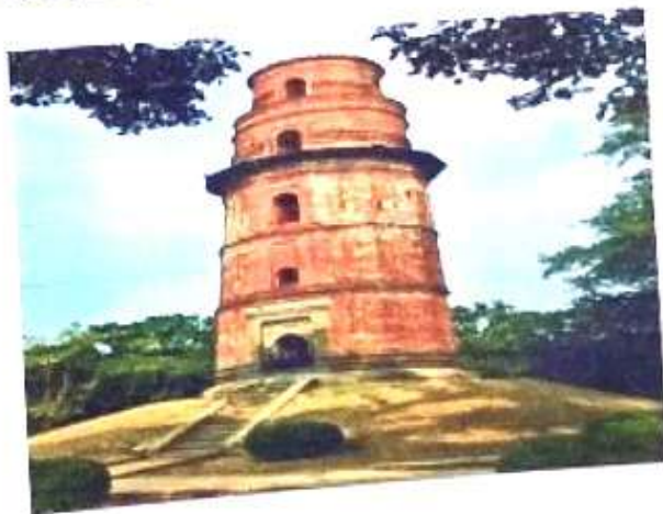
চিত্র নং, ১১ (ফিরোজ মিনার)