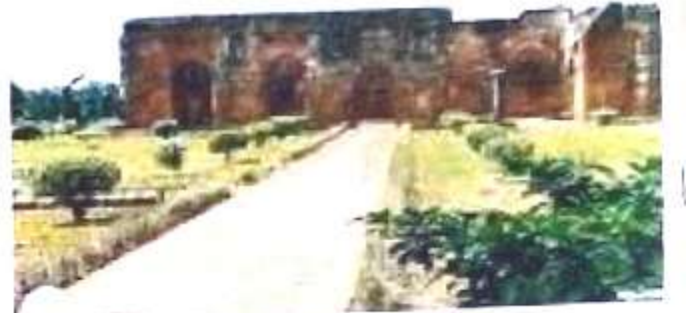
চিত্র নং, 4 (তাঁতি পাড়া মসজিদ)