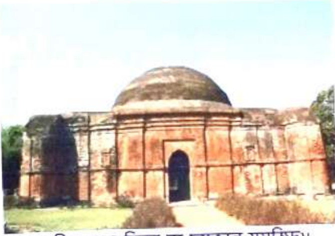
চিত্র নং, 3 (চিকা বা চমকান মসজিদ)।