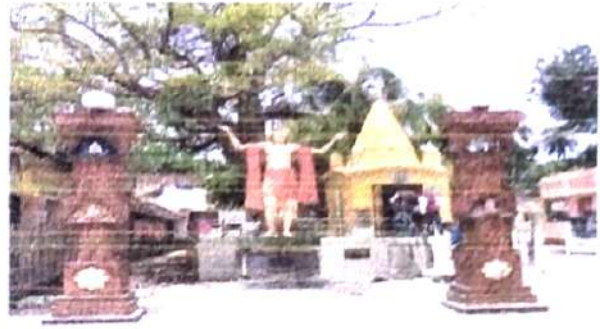
চিত্র নং 10 (বোমকেলি)