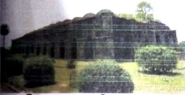
চিত্র নং, ১ (বোরদুয়ারি বা বড় সোনা মসজিদ)।