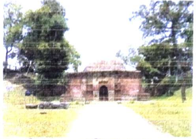
চিত্র নং, 8 (শুমতি দরওয়াজা)