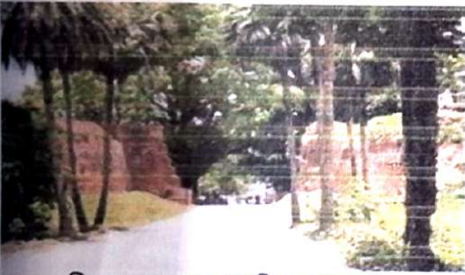
চিত্র নং, 9 (কোতোয়ালি দরওয়াজা)