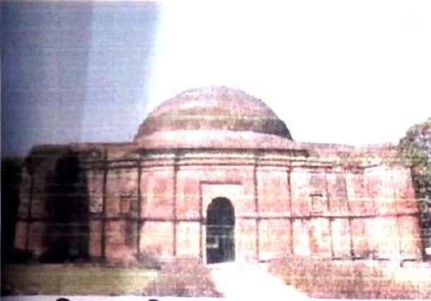
চিত্র নং, ৩ (চিকা বা চমকান মসজিদ)।