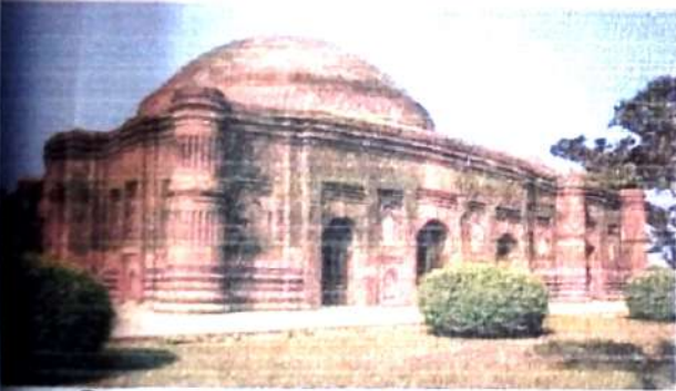
চিত্র নং, ৫ (লোটেন মসজিদ)।