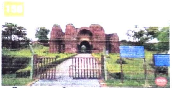
চিত্র নং, ৬ (দাখিল দারওয়াজা)