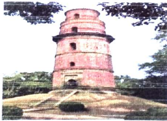
চিত্র নং, 11 (ফিরোজ মিনার)