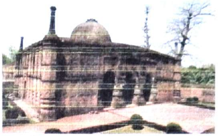
চিত্র নং, ২ (কদম রসুল মসজিদ)