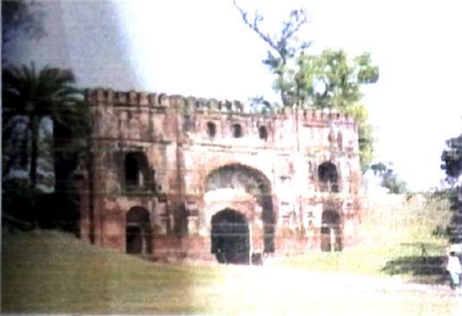
চিত্র নং, 7 (লুকোচুরি গেট বা লক্ষ ছিপি দরওয়াজা)