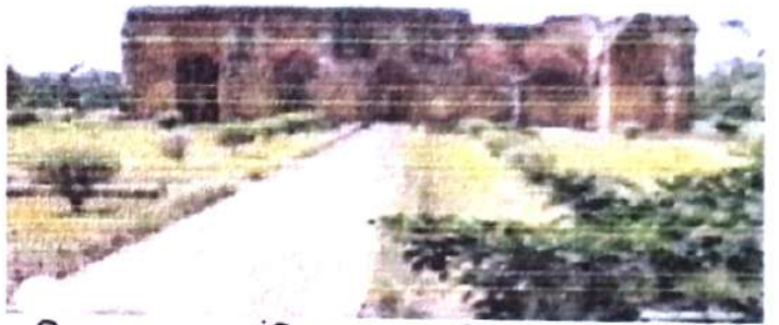
চিত্র নং, ৪ (তোঁতি শাড়া মসজিদ)